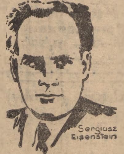
Wybitny radziecki reżyser filmowy. Twórca filmów historycznych jak „Pancernik Piotimkin” i inne.