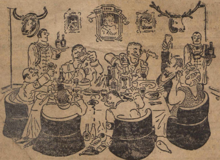
Anglicy witają Nowy Rok.