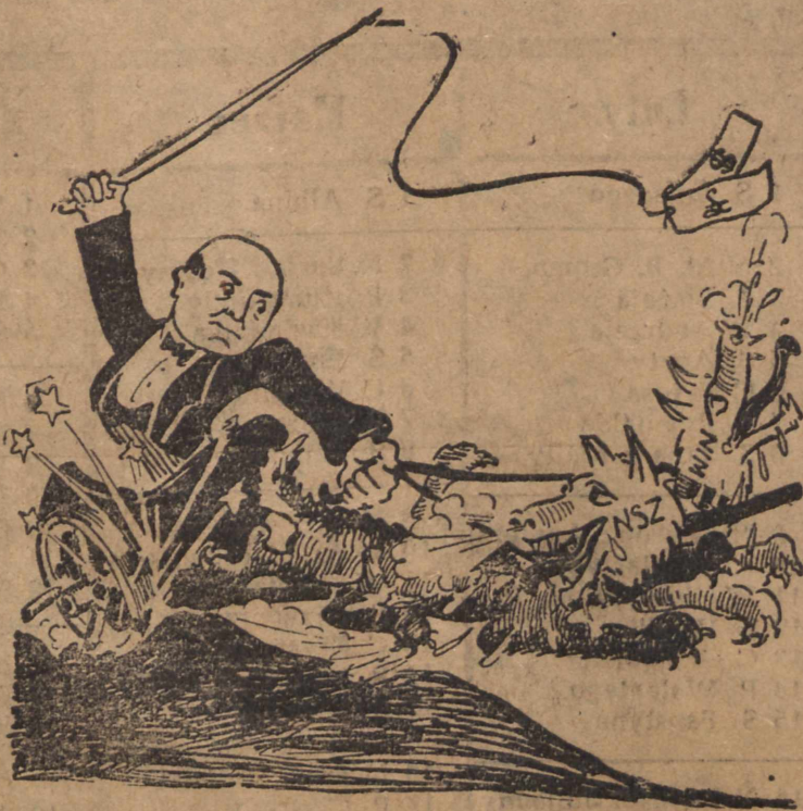
Na tych rumakach i z tym biczem zajadę chyba... do Londynu mości panie.