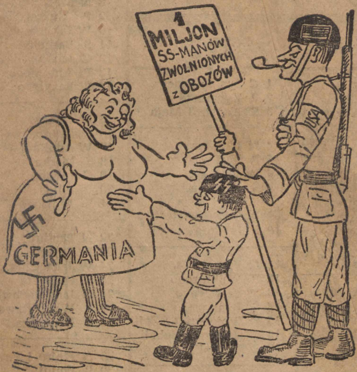
Amerykańska gwiazdka dla biednych Niemców.