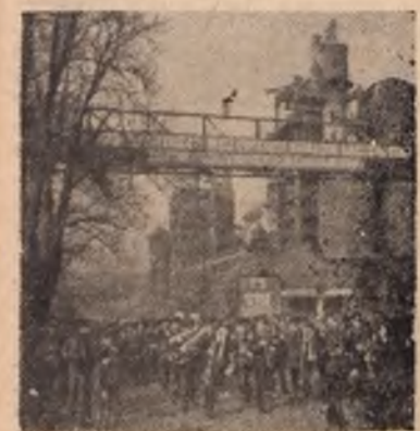
Zaloga huty „Pokój”, w celu wykonania przed terminem i z nadwyżką zadań planu na r. 1953, oraz dla uczczenia międzynarodowego dnia solidarności klasy robotniczej — 1 Maja, podjęła szereg zobowiązań produkcyjnych. Na zdjęciu: Pracownicy huty „Pokój” udają się do świetlicy, gdzie na uroczystej masówce podjęli zobowiązania.