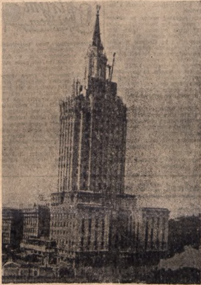
Na zdjęciu: Wieżowiec przy ulicy Kalaneczuskiej w Moskwie, przeznaczony na nowoczesny hotel.