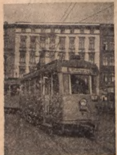
Jeden z wozów tramwajowych kursujących między Bytomiem a Stalimogrodem.