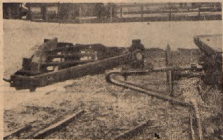
„Przystawka” z założoną deską, przed jej uruchomieniem.