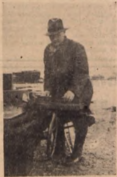
Próba racjonalizatora ob. Skłodowskiego.

niesie spółdzielni „Jedność” olbrzymie oszczędności oraz znacznie usprawni pracę robotnika, uczyni ją lżejszą. A wydajność pracy zakładu