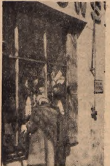
W sklepach lubelskich odbywają się obecnie Targi Wiosenne. Na zdjęciu przed wystawą jednego ze sklepów PDT przy ul. Narutowicza. Sklep ten ogłosił konkurs na najbardziej ujętego sprzedawcę.