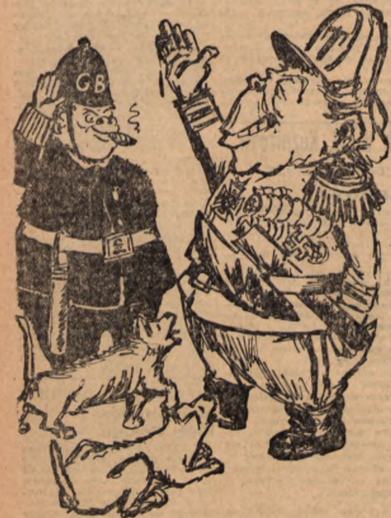
Towarzystwo jednej maści

Podczas swej „wizyty” w Londynie Tito „strzeżony” był przez 100 osób i 2000 policjantów. (Z prasy)