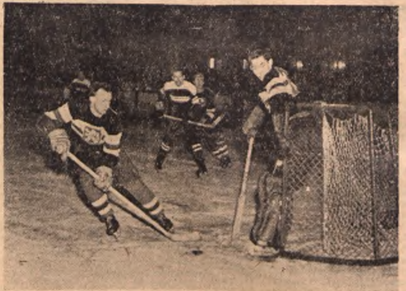
Odbyte w n. 29 stycznia br. w Katowicach drugie międzynarodowe spotkanie hokejowe reprezentacji Śląska i Czechosłowacji B zakończyło się zwycięstwem gości 4:3. — Na zdjęciu: fragment meczu Czechosłowacja B — reprezentacja Śląska.

CZECHOSŁOWACJA — B — REPREZENTACJA ŚLĄSKA 4:3 W HOKAJU