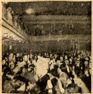
W dniu 14 grudnia 1952 roku uczestnicy Kongresu Narodów w Obronie Pokoju zstępowali go. i d. i. t. w. owacje przedstawiciele Bohater Kiej Jen - Sun.