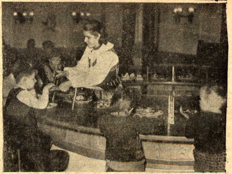
Centrala Przemysłu Ludowo - Artystycznego w Warszawie uruchomiła bar dla dzieci. Sądząc z min — dzieci są zadowolone. Kiedy taki bar powstanie w Lublinie?