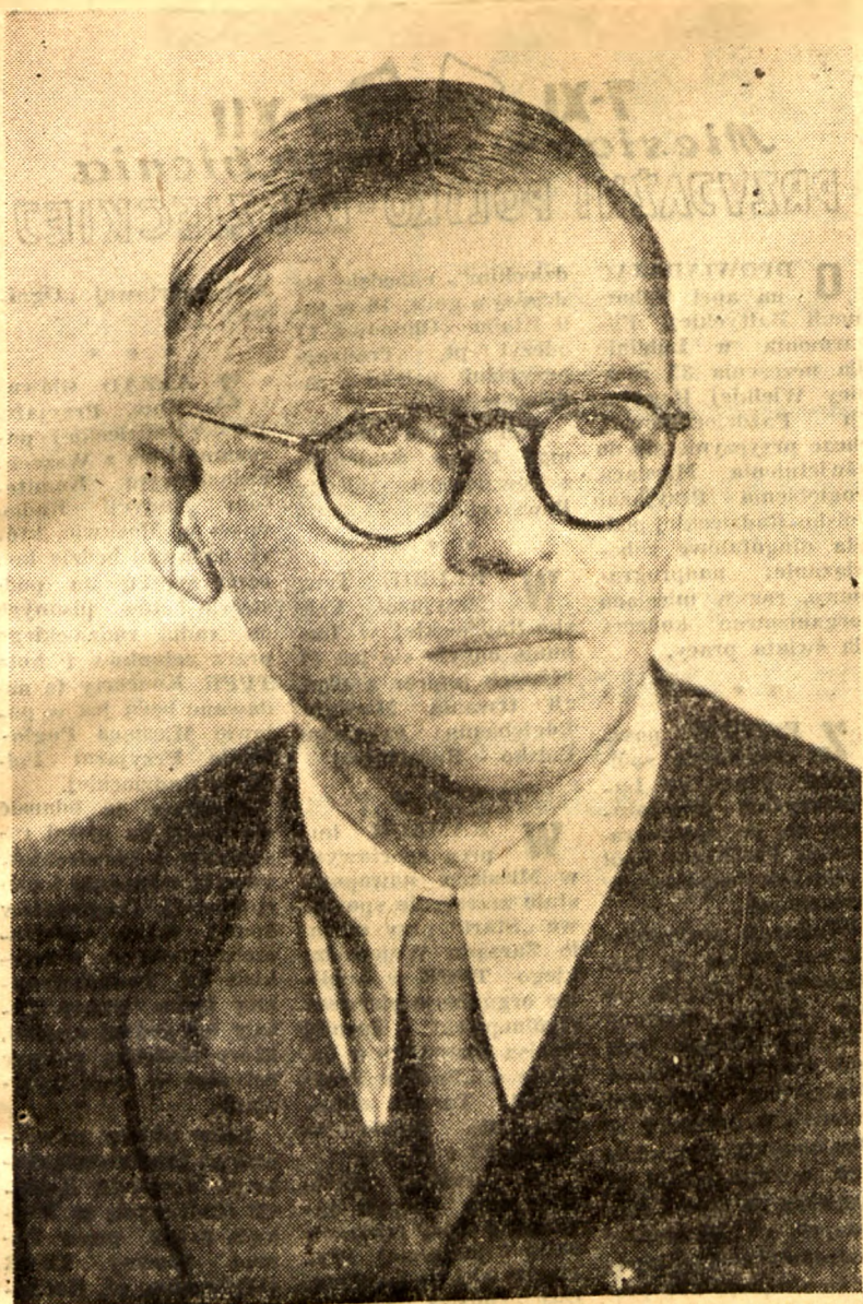
Przewodniczący Rady Państwa ALEKSANDER ZAWADZKI