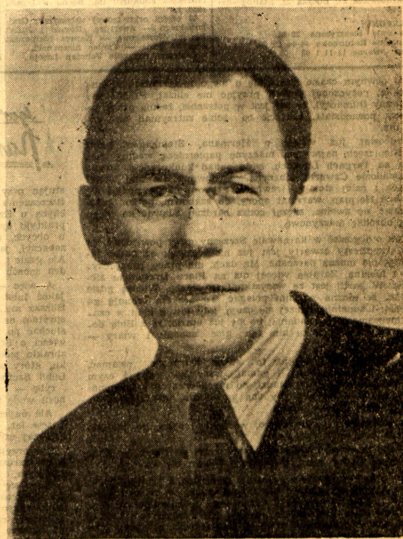
Marszałek Sejmu JAN DEMBOWSKI

Te trzy aspekty: jedność narodu polskiego, oparcie budownictwa państwowego na podstawach naukowych i obrona pokoju świata, to trzy główne podstawy działalności naszego Państwa Ludowego i Wysoka Izbo, oddając jednogłośnie swe głosy na przedstawicieli tych właśnie kierunków, raz jeszcze dala dobitny wyraz jedności narodu polskiego w dziele budowy ustroju sprawiedliwości społecznej. To chciałbym wyraźnie podkreślić. (Długotrwałe oklaski).