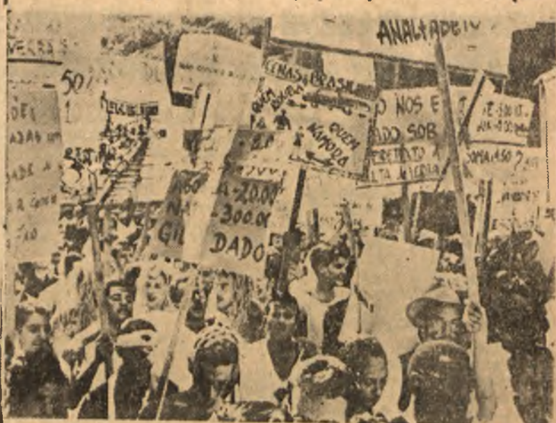
Ludność Brazylii protestuje przeciwko budżetowi wojennemu rządu brazylijskiego, spełniającego rozkazy imperialistów amerykańskich. Na zdjęciu: fragment demonstracji studentów w Rio de Janeiro.