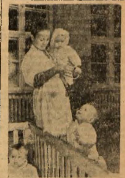
Realizacja Programu Wyborczego Frontu Narodowego to między innymi szeroko rozwinięta opieka Państwa Ludowego nad matką i dzieckiem, to jasna przyszłość naszych dzieci. Na zdjęciu: w Państwowym Domu Matki i Dziecka w Ciechanowie - dzieci bawią się pod opieką jednej z matek.

Przykłady te świadczą, że kontrola nad pracą młynów jest niedostateczna i wzmocnienie jej jest kwestią palącą. Młynarze popełniający nadużycia powinni być przykładowo ukarani. Nie wolno pozwolić, aby młynarze - spekulanci okradali Państwo i chłopów.