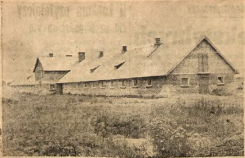
Państwowe Gospodarstwa Rolne są ważnym czynnikiem podniesienia produkcji hodowlanej. Inwestycje budowlane w PGR-ach w znacznym stopniu uwzględniają zagadnienie hodowli trzody chlewnej. Na zdjęciu: wozorowa chlewnia w PGR Jarosławiec, w której znajduje pomieszczenie 360 sztuk świń.

Wskazania VII Plenum KC PZPR powinny zmobilizować rady narodowe, kierownictwa zakładów pracy oraz aktyw Ligi Kobiet. Trzeba otoczyć należytą opieką kobiety pracujące, udostępnić im drogę do nowych zawodów, do zdobycia nowych kwalifikacji zawodowych oraz wzmocnić pracę polityczno-uświadamiającą wśród kobiet dotychczas niepracujących, które jeszcze nie zawsze rozumieją korzyści, jakie daje im praca zawodowa, nie zdają sobie sprawy z obowiązków, ciążących na nich jako współgospodarczycielki Polskiej Rzeczypospolitej Ludowej.