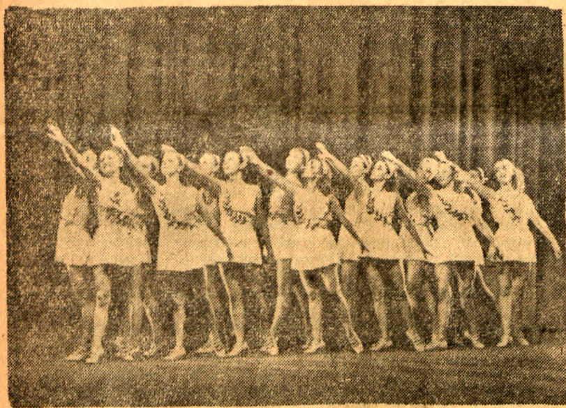
Zespół „Malwy” wykonuje taniec „Spartakiada”.

TELEFONY: Biuro Elektryczne 29-61 Biuro Kulturalne 44 44 i 09. Biuro Rozm. 11 11 i 08