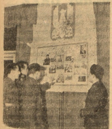
Grupa podchorążych Oficerskiej Szkoły Politycznej z zainteresowaniem ogląda gazetkę ścienną, poświęconą projektowi Konstytucji Polskiej Rzeczypospolitej Ludowej.

Zastanówmy się teraz, czy sposób w jaki KG w Zaklikowie chce likwidować „białe plamy” w swojej gminie jest słuszny i celowy. Prze-