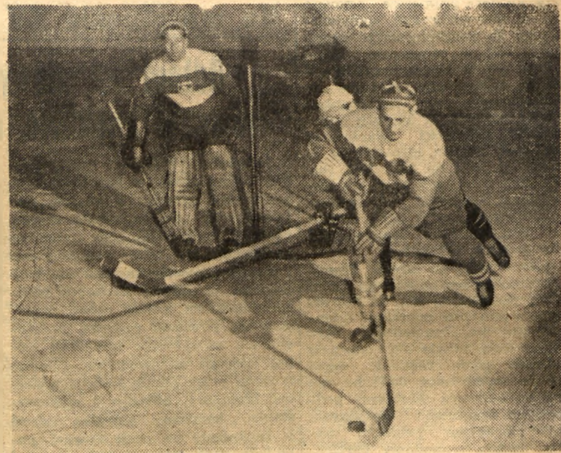
Na lodowisku CWKS w Warszawie odbył się turniej hokejowy AZS o mistrzostwo Polski, w którym brało udział 5 zespołów.

W pierwszym dniu turnieju drużyna Poznania pokonała Lublin w stosunku 5:3 (0:0, 4:1, 1:2). — Na zdjęciu fragment tego spotkania.