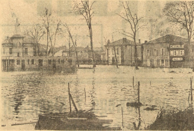
Ostatnio południowe obszary Francji nawiedziła klęska powodzi. Wezbrane wody rzek zalały wiele miast, wsi i osiedli. Dziesiątki ofiar w ludziach, miasta i wsie zalane wodą, milionowe straty — oto bilans pierwszych dni powodzi.

Ludzie ci mają prawo do wdzięczności narodów.