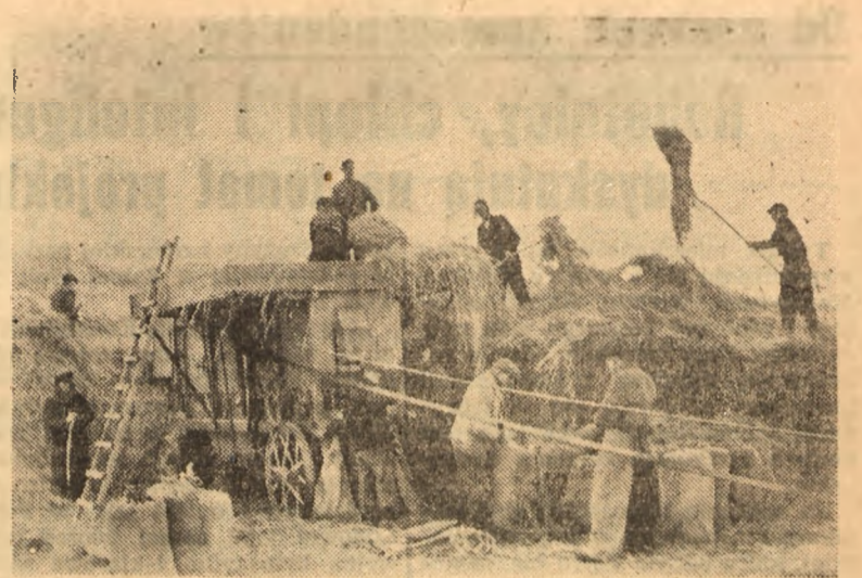
Zwiększenie powierzchni zasiewów zbóż jarych o 6,5 proc. w stosunku do roku ubiegłego, stawia przed rolnikami bojowe zadanie w przeprowadzeniu tegorocznej kampanii siewów wiosennych.

Przygotowanie maszyn, nawozów sztucznych i ziarna — oto najpilniejsze prace w obecnym okresie przygotowawczym.