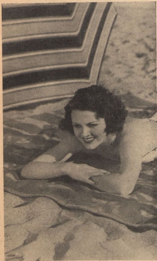
Miło jest beztrudno wypoczywać na słonecznej plaży...