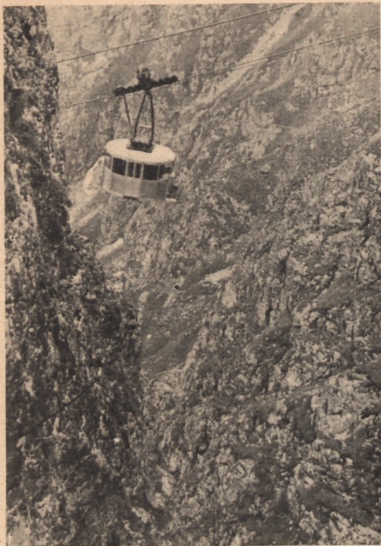
Kolejka na Kasprowy