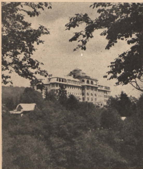
Sanatorium nauczycieli w Zakopanem