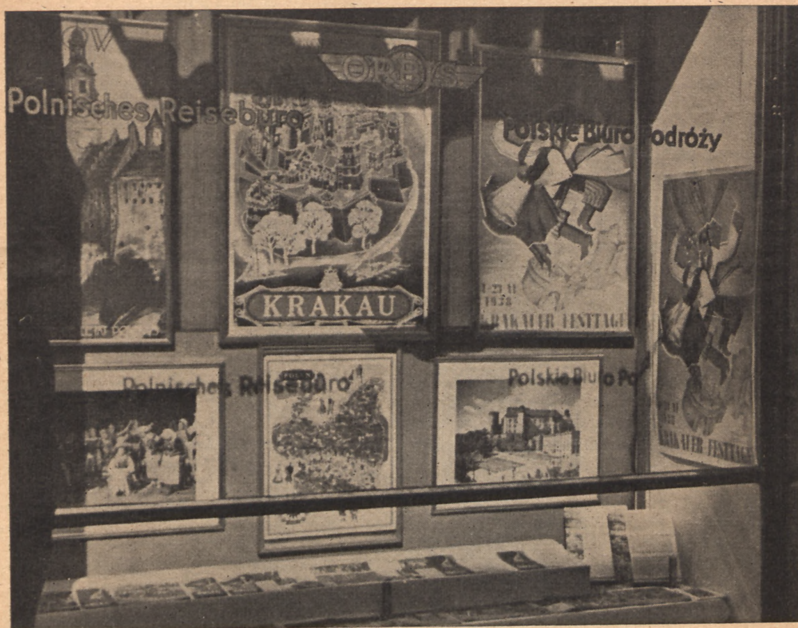
Oddział Orbisu w Berlinie.