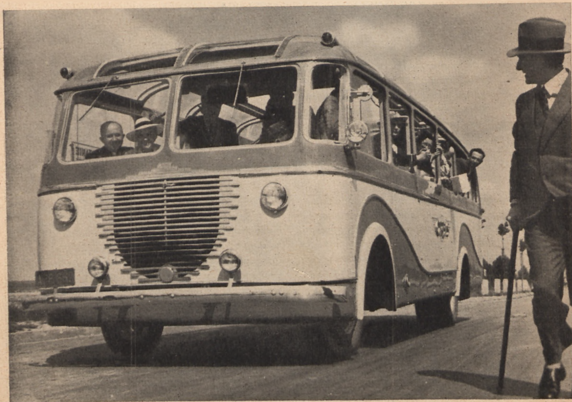
W drodze do Wilanowa

Stały program zwiedzań Warszawy autokarem ORBISU przewiduje 3 zasadnicze tury: pierwsza z nich, to „Objazd starej i nowej Warszawy”. Zwiedzanie stolicy wg tej tury odbywa się w środy i piątki w godzinach 10 — 13 oraz w niedziele i święta w godzinach 11 — 14. Cena zł 6.50 od osoby obejmuje przejazd, zwiedzanie, napiwki oraz