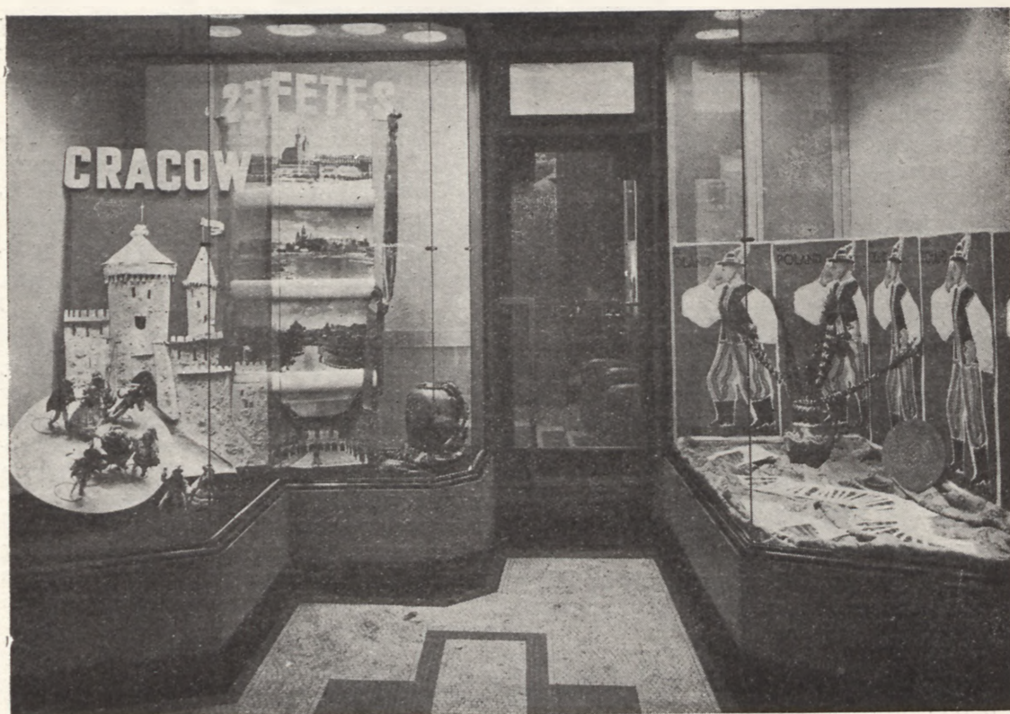
Oddział Orbisu w Londynie