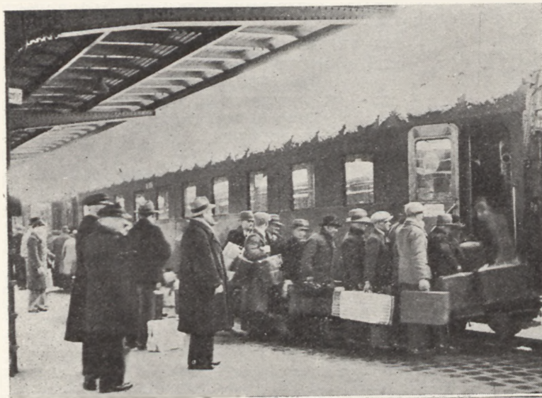
ZAWAGONOWANIE ROBOTNIKÓW ROLNYCH UCZESTNIKÓW TRANSPORTU ODPRAWIONEGO DO LUKSEMBURGA

Transporty robotników sezonowych odprawione przez »ORBIS« do Luksemburga i Estonii