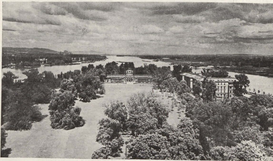
BUDAPESZT — Zakład kąpielowo-leczniczy i hotel kuracyjny na wyspie Św. Małgorzaty.

Blizszych informacji udzielają wszystkie placówki Orbisu.