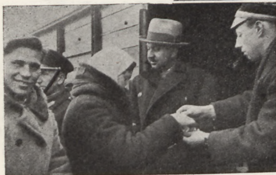
ODPRAWA NA STACJI POSTAWY ROBOTNIKÓW ROLNYCH SEZONOWYCH UDAJĄCYCH SIĘ Z WILEŃSZCZYZNY DO ESTONII