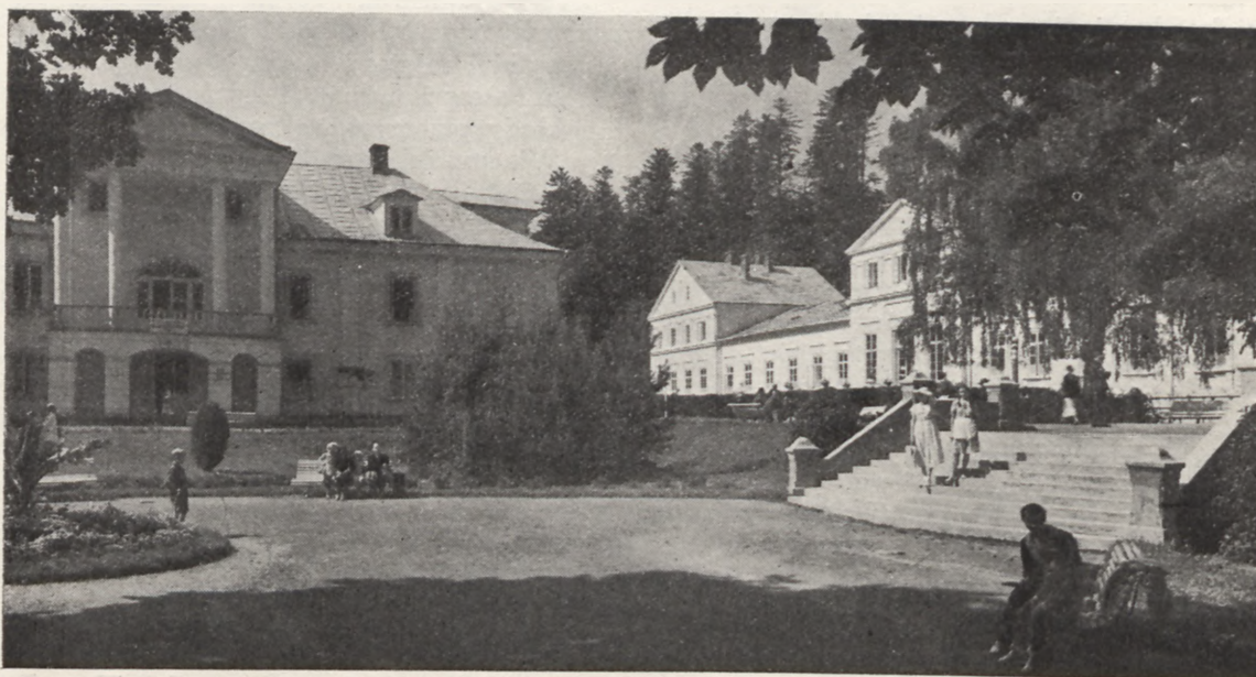
Zakład Zdrojowy w Iwoniczu

Dn. 24 kwietnia — Całodzienna wycieczka do Ojcowa przez Sosnowiec, Będzin, Olkusz, Ojców, Bielany, Trzebinę. Koszt udziału w wycieczce zł. 18.