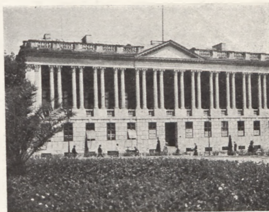
Biblioteka Raczyńskich w Poznaniu

Od tych, świetnych dla miasta czasów, Poznań zyskał sobie opinię miasta wystawowego. Po popularnej „Pewuce” przychodzi wystawa komunikacyjno - turystyczna, a po