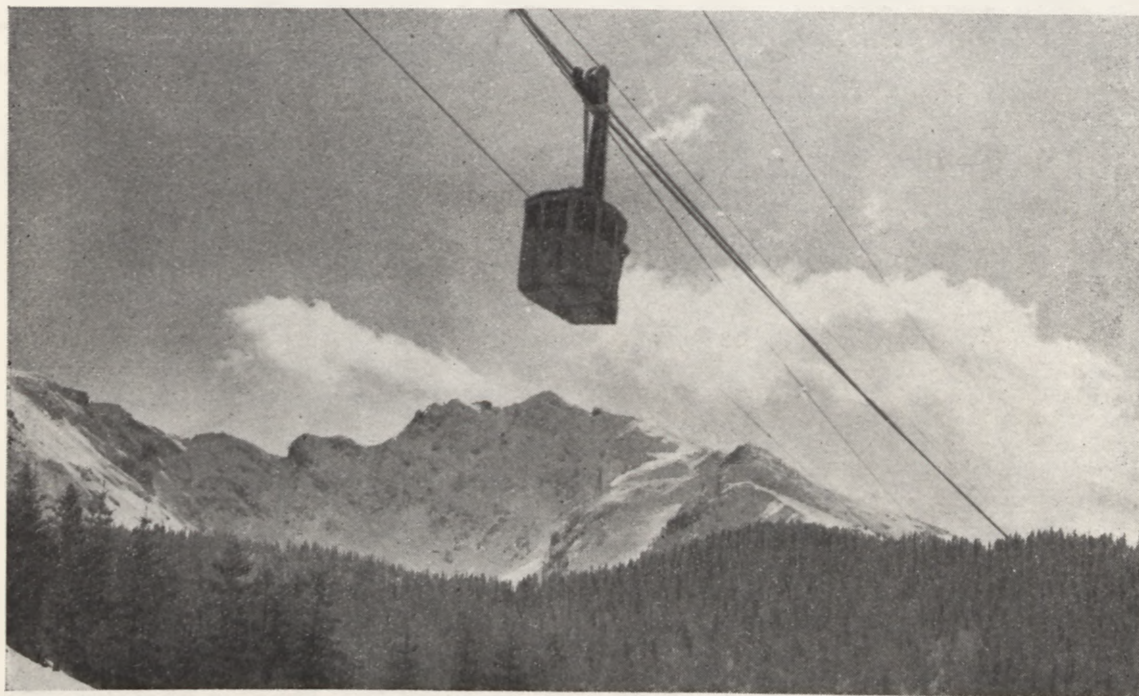
Kolejka na Kasprowy

24 kwietnia — wycieczka autobusowa do Tomaszowa Maz. i Niebieskich Źródeł. Zapisy na wycieczki lokalne przyjmują poszczególne placówki miejscowe Orbisu.