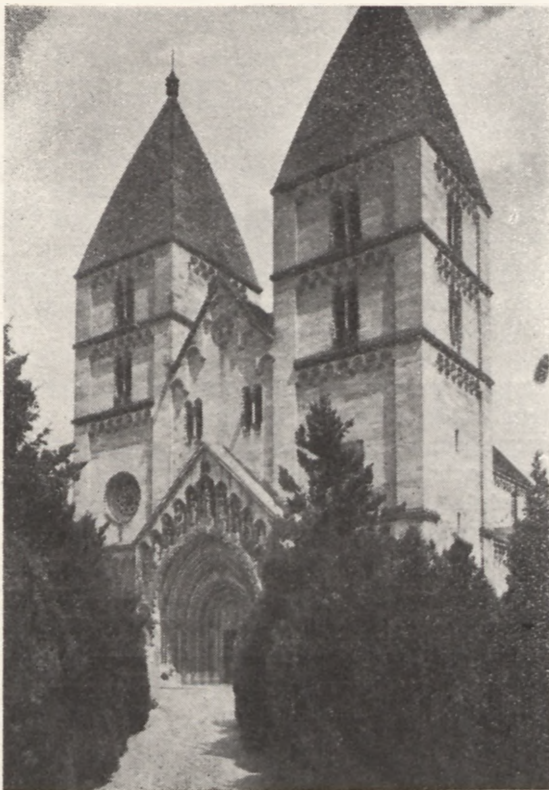
Starożytny kościół w Jak, z epoki Arpadów

Budapesztu i z powrotem, pobyt 5-dniowy w Budapeszcie z mieszkaniem i utrzymaniem (zależnie od wymienionych kategorii), karta legitymacyjna upoważniająca do zniżkowej wizy, zniżki kolejowej oraz zniżkowych opłat wstępu podczas zwiedzania muzeów w Budapeszcie, miejsce siedzące przed wielkim ołtarzem na głównym placu uroczystości, przewiezienie z dworca do hotelu i z powrotem, wpis na paszport zbiorowy, wizy węgierska i czeska — oraz opieka przewodnika w czasie trwania pielgrzymki.