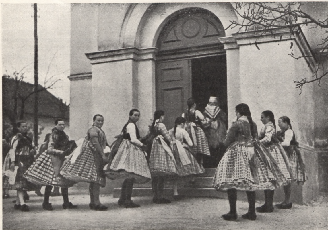
W niedzielę do kościoła... Węgierskie wieśniaczki w pięknych strojach ludowych.

Przypominamy również, że ceny uczestnictwa w tej jedynej Pielgrzymce zostały obliczone jak najprzystępniej w 4-ch różnych kategoriach po zł 128, zł 175, zł 200 i zł 225. Zależnie od różnicy tych cen uczestnicy pielgrzymi są lokowani w Budapeszcie w skromnych kwaterach zbiorowych, w internatach, w pensjonatach i hotelach mniej i więcej wykwintnych. Natomiast w cenie tej mieści się jednakowy dla wszystkich przejazd kolejowy III klasą od granicy Polski do