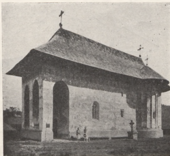
Klasztor w Gura Humorului

Powracając na szosę, trzeba przejechać miasto Storjinec, aby dostać się do Czerniowiec, stolicy Bukowiny, siedziby biskupa obrządku greckiego. Jego wspaniały pałac stanowi prawdziwą ozdobę miasta.