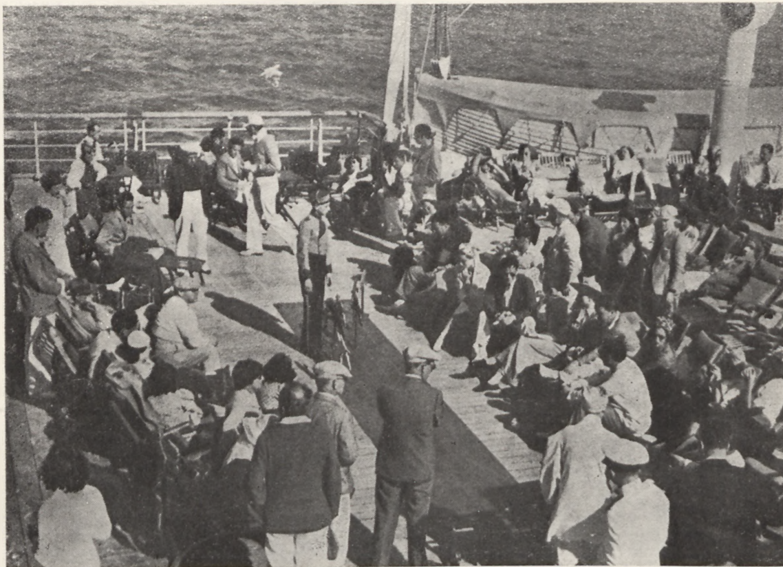
Wycieczka na pokładzie statku polskiego

Cena kosztu wycieczki, obejmująca przejazd statkiem „Polonia” z utrzymaniem w obie strony, wizy i paszport, wynosi od zł 375, zależnie od ceny kabiny. Podczas przejazdów lądowych do Konstancy i z powrotem, pasażerowie korzystają ze zniżki 33% na kolejach polskich i 33% na rumuńskich. Zapisy na wycieczkę w placówkach Orbisu.