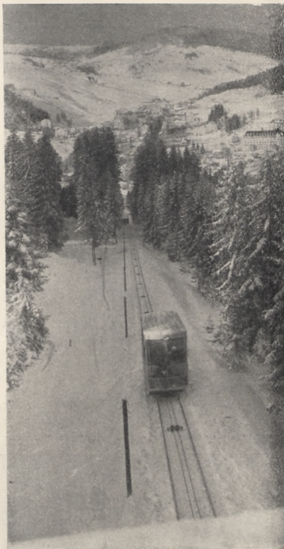
Kolejka i widok na Krynice

W zimie dla narciarzy, w lecie dla najszerzych mas kuracjuszków i turystów kolejka krynicka jest prawdziwym szczęściem, udostępniając przepiękne tereny narciarskie, wspaniałe widoki no i... zbliżając do słońca, które na Górze Parkowej grzeje i promieniuje najsilniej w całym uzdrowisku.