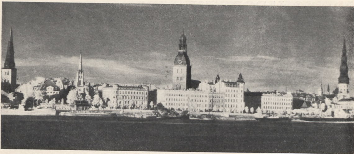
Widok Rygi od morza