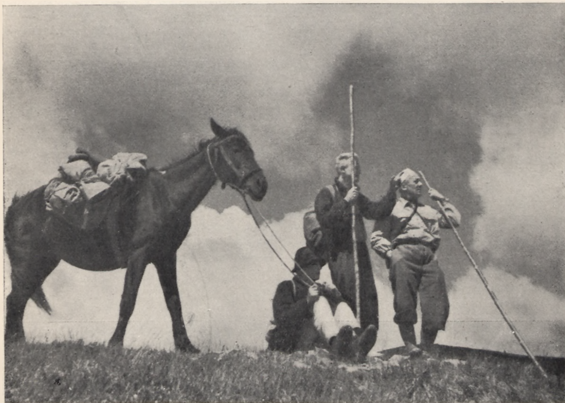
Wiosnany wiatr w Gorganach.