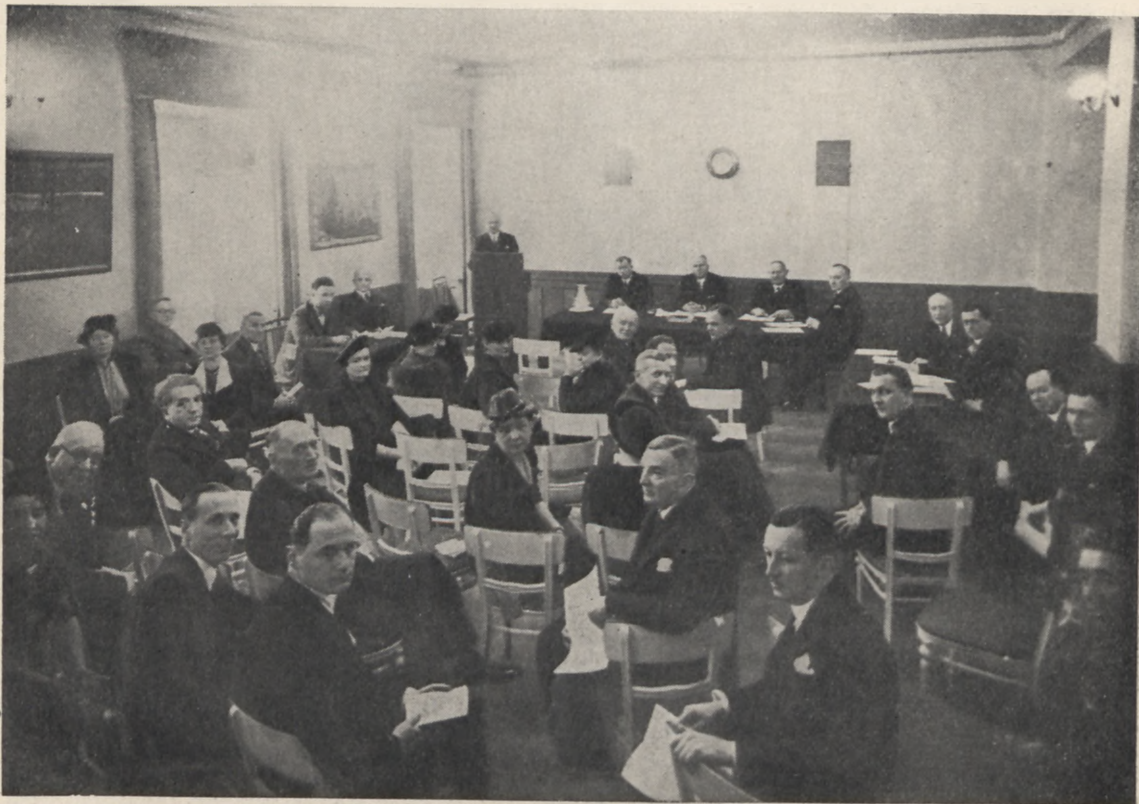
Obrady Nacz. Org. Polsk. Przemysłu Hotelowego

Po zebraniu odbył się uroczysty bankiet w Sali Malinowej Hotelu Bristol w W-wie z udziałem zaproszonych gości i członków N.O.P.P.H.