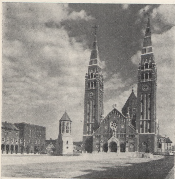
Piękna Katedra w Szeged na Węgrzech