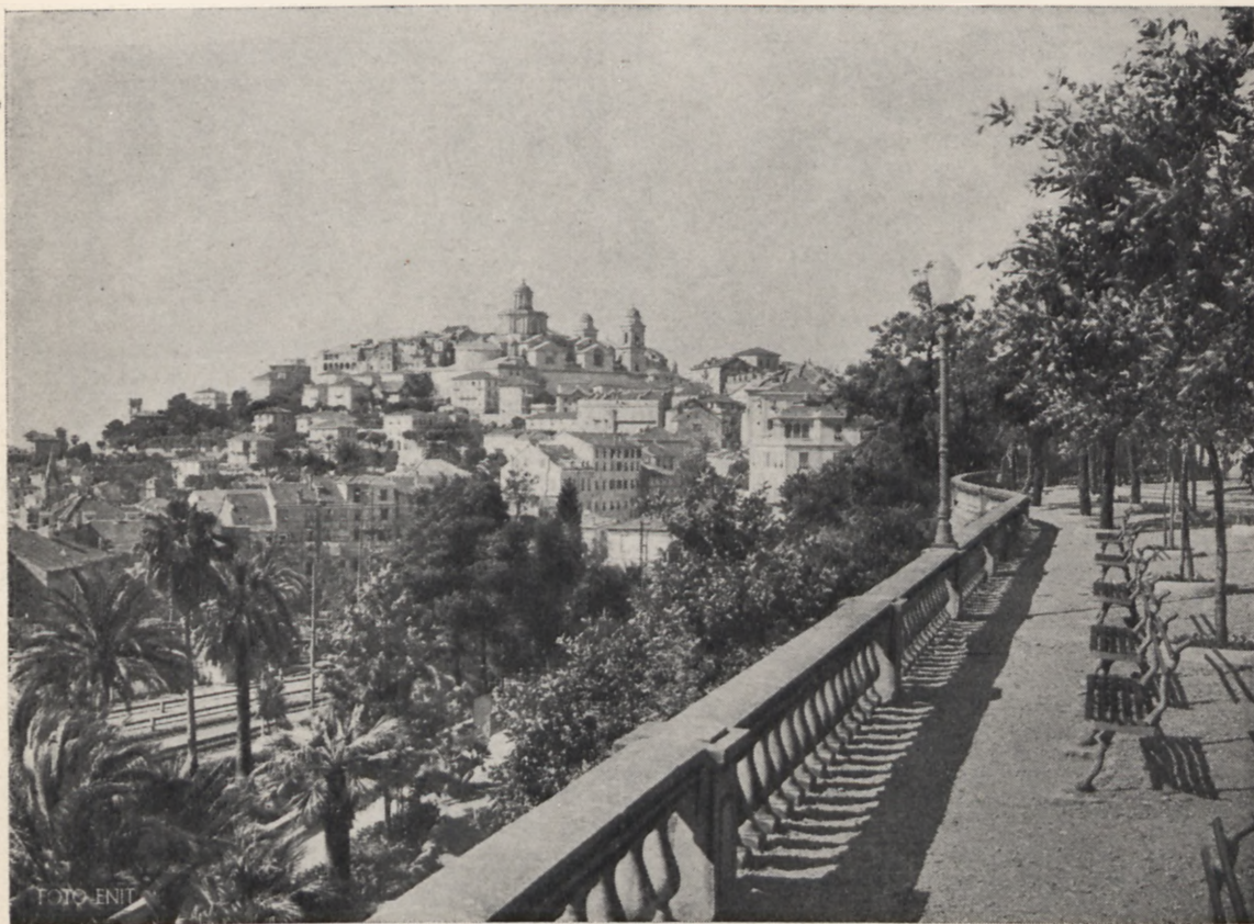
Typowe, piękne miasteczko włoskie

Tak na przykład z organizacji technicznej Orbisu korzysta wycieczka, organizowana przez Ognisko Filologii Klasycznej w Lublinie, udająca się w okresie wielkanocnym do Italii; również wycieczka uczestników X-go Międzynarodowego Kongresu Chemii, jest organizowana przez Orbis w porozumieniu z Polskim Towarzystwem Chemicznym. Wycieczka ta zwiedzi Rzym, Neapol, Pompei itd.