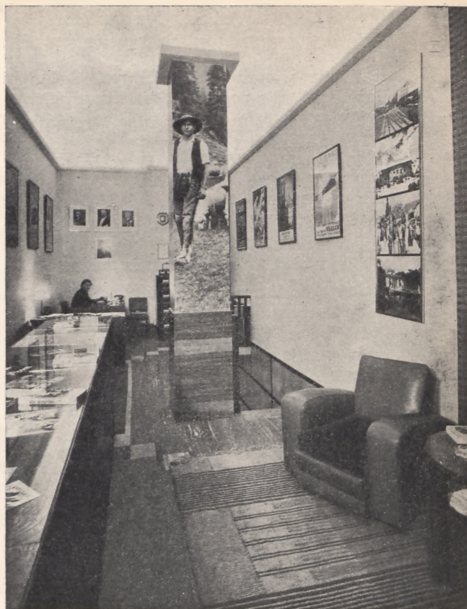
Fragment wnętrza reprezentacyjnego biura Orbisu w Londynie

Korzystając z zainteresowania Anglików akcją polską, placówka Orbisu w Londynie przystąpiła do szerzej działalności propagandowej. Urządzono okna wy-