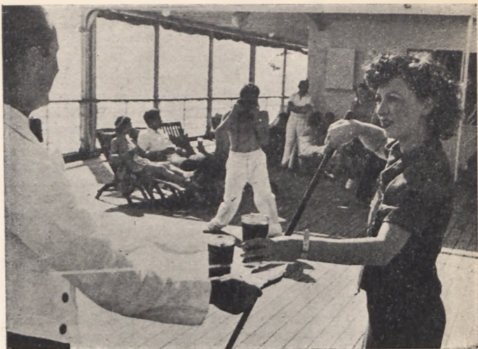
Na pokładzie m/s „Piłsudski”

Wspaniałe tereny sportowe znajdują się w Karpatach Rumuńskich. Ośrodkiem sportów zimowych jest Sinaia, jedna z rezydencji króla i jego dworu. Prospekty, informacje o wyjazdach i wycieczkach do Rumunii w placówkach Orbisu.