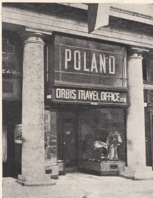
Wejście do lokalu Orbisu w Londynie na Lower Regent Street