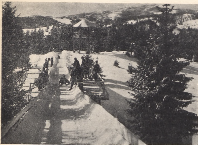
Tor saneczkowy w Krynicy