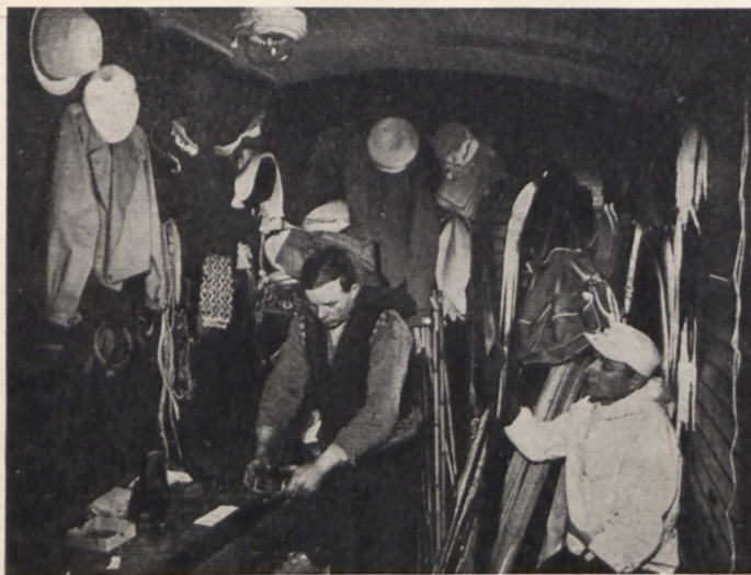
Reparacja nart w wagonie narciarskim pociągu raidowego

Wycieczki narciarskie odbywają się w trzech grupach według stopnia wycwiczenia uczestników. Tworzy się grupy ćwiczebne dla nowicjuszków jazdy na nartach. Osobne wycieczki dla osób nie umiejących jeździć na nartach.