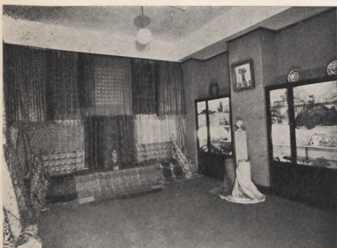
1-sza Wystawa sztuki ludowej i dekoracyjnej w lokalu Orbisu w Londynie

W dziedzinie turystyki polskiej i propagowania wśród obcych podróży i wycieczek do Polski, Orbis będzie niezawodnie mógł poczynić znaczne postępy dzięki swej penetracji na rynek angielski. Anglia jest