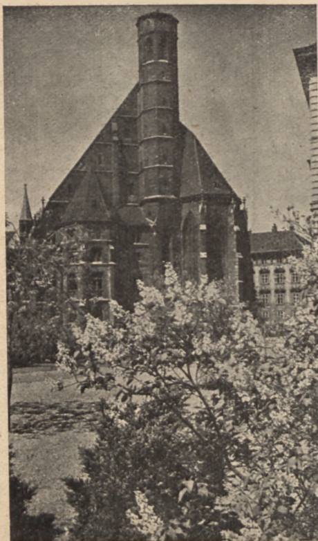
Oesterreichische Lichtbildstelle Wien I. Grabe : 20

Cena udziału w wycieczce obejmująca paszport, wizę, przejazd kolejowy z Wilna do Rygi i spowrotem, całkowite utrzymanie w hotelu, zwiedzanie miasta i opiekę przewodnika wynosi zł. 90.— przy przejazdach w kl. III, a zł. 98.— przy przejazdach w kl. II. Program wycieczki przewiduje, oprócz zwiedzania Rygi, także fakultatywne wycieczkę na wybrzeże ryskie za osobną dopłatą.