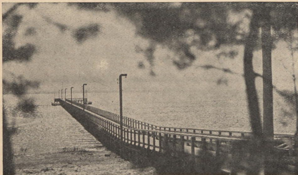
Jurata — pomost spacerowy

Za cenę ryczałtową zł. 29 otrzymują goście komfortowe mieszkanie z doskonałym, świątecznym utrzymaniem.