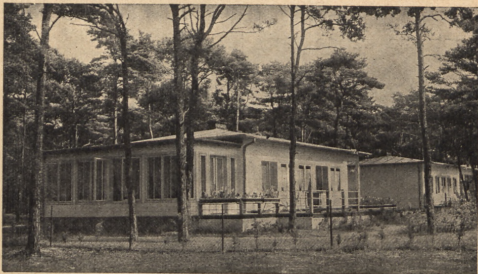
Jurata — domki campingowe

cie, naszym najpiękniejszym i najelegantszem uzdrowisku morskiem na półwyspie helskim, organizuje Orbis 5-dniowy pobyt ryczałtowy w luksusowych warunkach, po 45.— zł. od osoby, za całkowite utrzymanie, z wyjątkiem zakąsek, podwieczorków i napiwków. Zarząd pensjonatu „Lido” urządzi