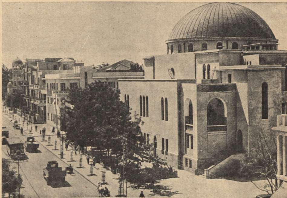
Wielka Synagoga w Tel-Awivie

Przed odjazdem statków organizuje Orbis specjalne pociągi z Polski (Warszawa — Lwów) bezpośrednio do Konstancy. Miejsca rezerwowane. Sprzedaż kart okrętowych do Palestyny, informacje o wycieczkach po Ziemi Świętej, Syrii, Egipcie — we wszystkich placówkach Orbisu, specjalnie w Dziale Morskim, Warszawa, Marszałkowska 153.