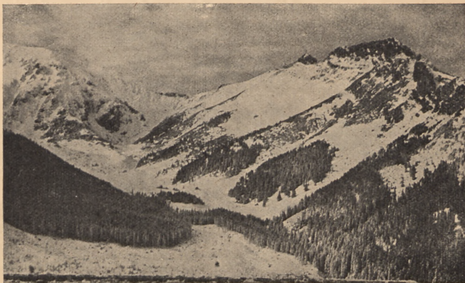
Dolina Kondratowa w Tatrach.

W czasie wiosny tatrzańskiej hasającemu po śniegu narciarzowi niejednokrotnie jest cieplej, niż