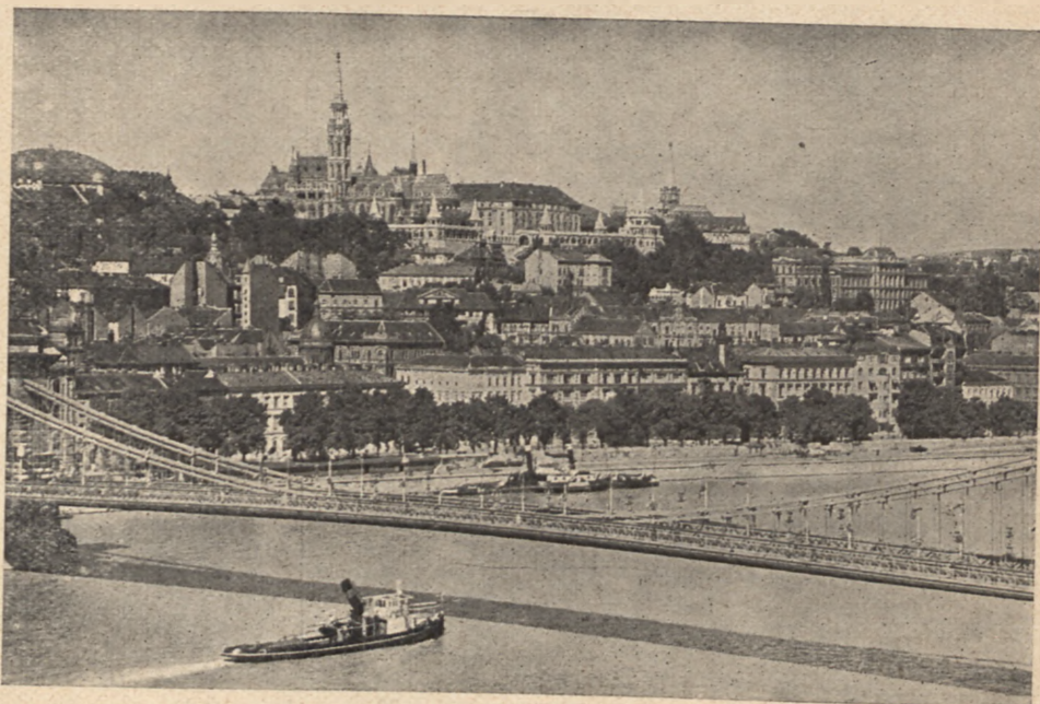
Widok na Budapeszt i Dunaj