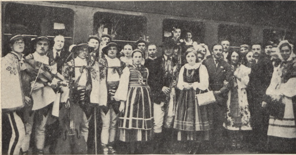
Polska delegacja na Kongres Tańców Ludowych w Londynie

Przeprowadzki — Transporty lądowe i morskie — Odprawy celne — Bagaże — Międzynarodowe Transporty