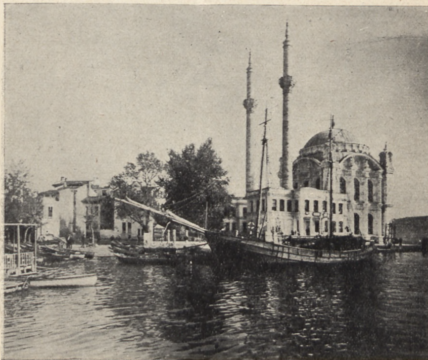
Meczet nad Bosforem

Cena udziału w wycieczce zł. 490. — obejmuje następujące świadczenia: