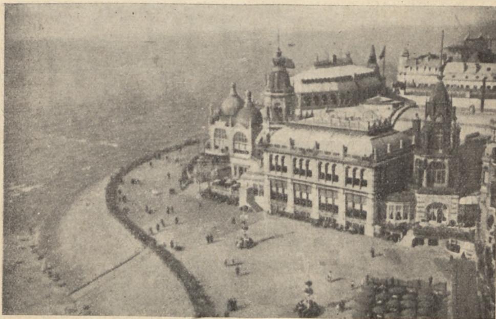
Kasyno w Ostendzie

Osoby pragnące zapewnić sobie mieszkanie w Brukseli (wobec kolosalnego zjazdu otrzymanie pokoju hotelowego lub pensjonatowego bez zamówienia z góry jest wykluczone), mogą to uczynić, opłacając z góry przy zapisie należność za czas pobytu w Brukseli.