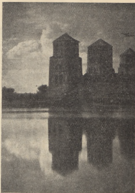
Ruiny zamku w Mirze (woj. nowogródzkie)

Cała wycieczka — przejazdy kolejowe, noclegi, wyżywienie, wycieczki z Zaleszczyk — kosztuje zł. 135.—