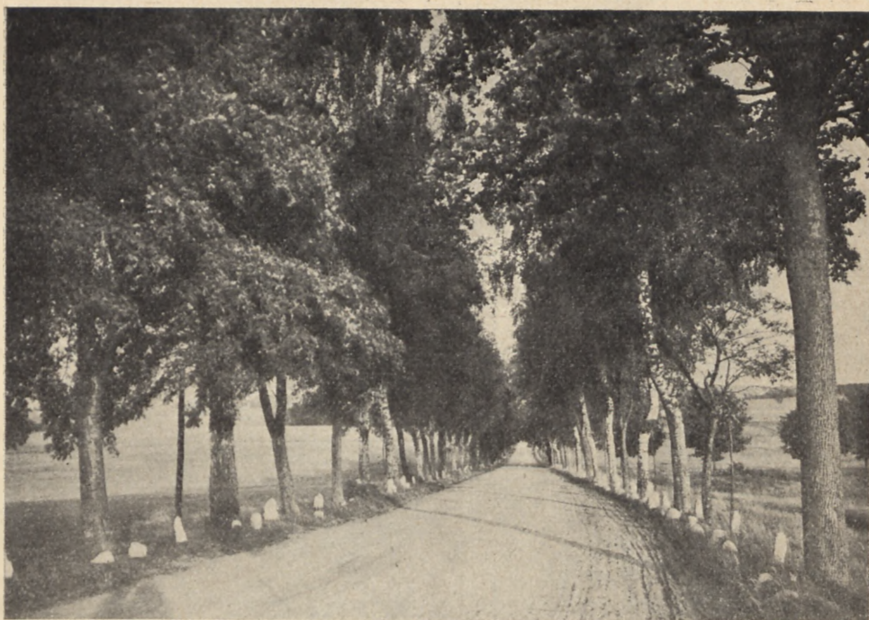
Droga z Pucka do Swarzewa nad morzem