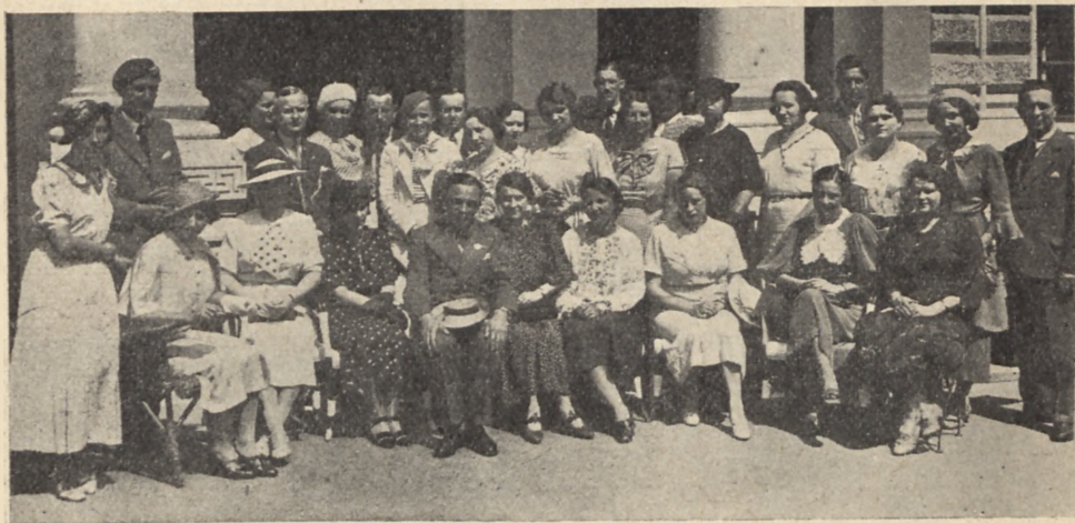
Wycieczka „Rodziny Wojskowej” na Południu