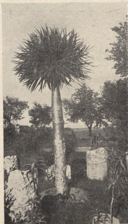
Fragment z parku w Warnie.