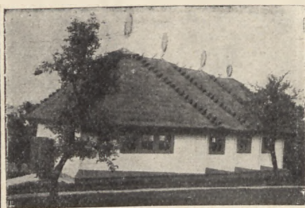
Pawilon „Przemysłu Ludowego“ na VI Targach Wołyńskich w Równem zbudowany w stylu chaty wołyńskiej.