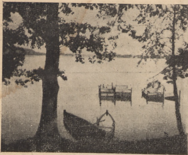
Jezioro Święte Zdjęcie od strony falez