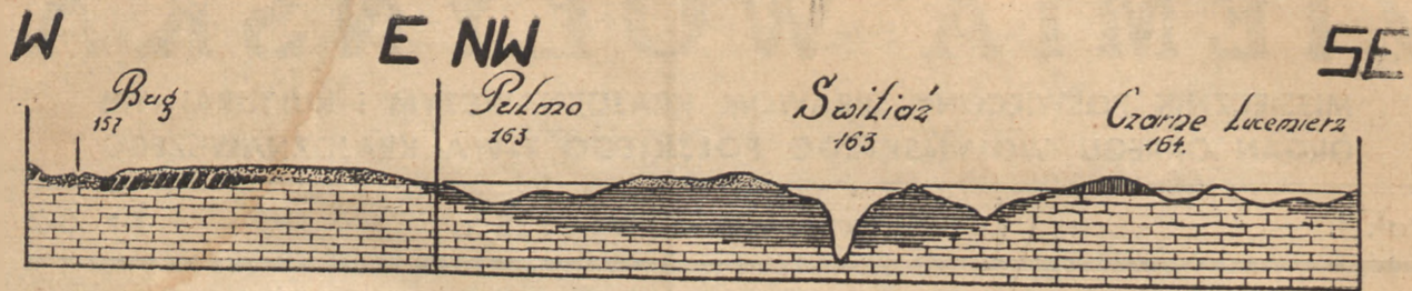
Schematyczny przekrój geologiczny przez kotlinę przedlodowcową Bug-Szack.