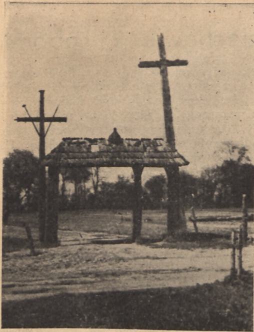
Metyw z okolicy jeziora Świtiaż

Nad jeziorem, w bezpośrednim jego sąsiedztwie, żyje człowiek — we wsi tej samej nazwy. Poczciwy on i gościnnie, szczerością na szczerość odpowiada, o dużym zmysle artystycznym i wrodzonym zamiłowaniu do piękna. W barwnym chodzie stroju, w koszuli wzorzystym haftem bogato zdobionej, wzorzystym ręcznikiem cały dom przystraja, otaczając go sadem i charakterystycznym płotem z drągów wiązanych łożą (przypominającym huculskie). Żyje obecnie z roli, często sochą uprawianej, sadząc głównie cebulę i jarzynę na wysokich, w rodzaju poleskich, grządkach; kiedyś okoliczne jeziora stanowiły dla niego jedyne i główne źródło utrzymania. Dziś podział nastąpił; ogół żyje z gleby i tylko kilka rodzin we wsi — to tradycją żyjący i z jeziorami związani rybacy. Tych ciągnie na wodę nie tyle zawód, co w krwi płynąca już namiętność.