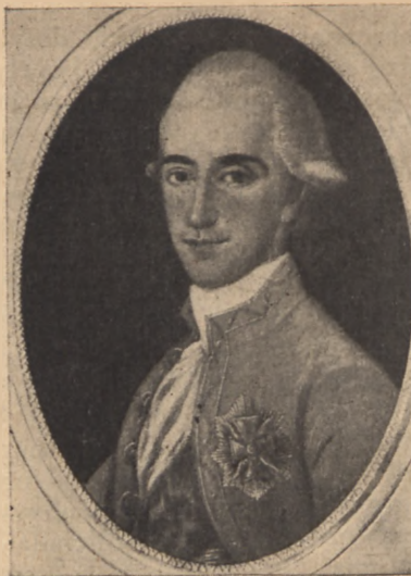
Portret nieznanego malarza (Pitschman?) w Derażnem