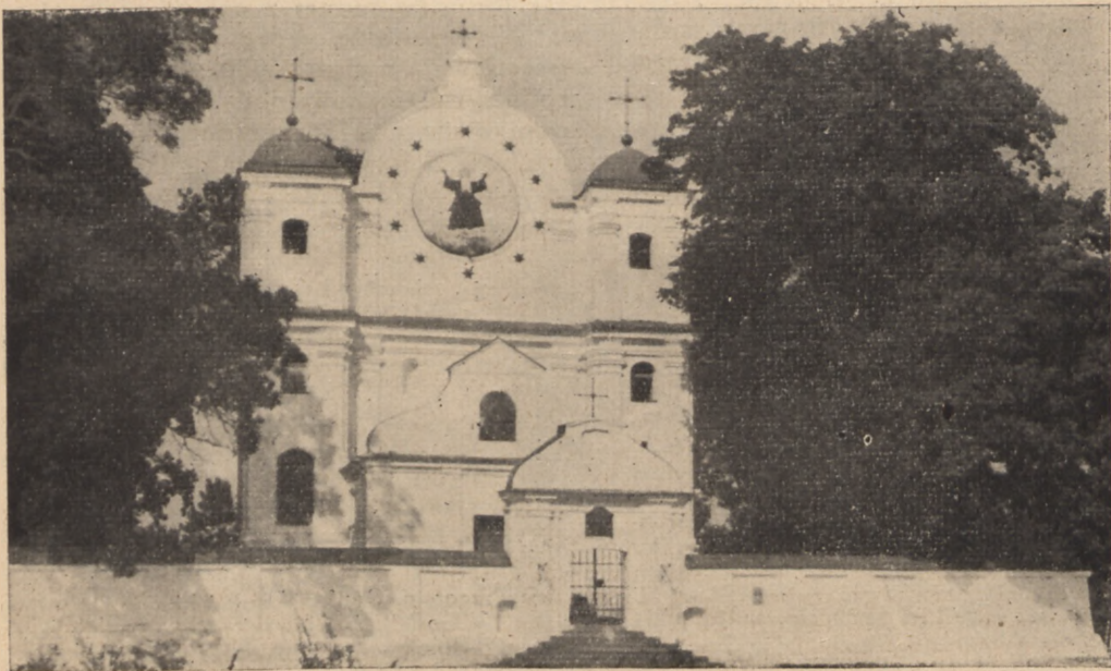
Kościół poaugustiański (obecnie cerkiew) w Radziechowie