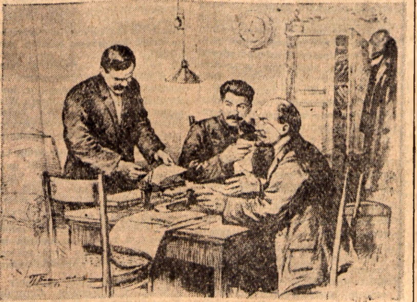
Włodzimierz Lenin, Józef Stalin i Władzisław Mołotow w redakcji gazety „Prawda” w 1917 r.