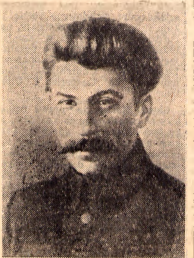
Józef Stalin w młodości

lizmu w ZSRR Stalin obronił ją przed zamachami ze strony trockistów i bucharinowców. Teoria przedzieliła masy, znalazła ucieleśnienie w gigantycznych budowach stalinowskich pięciolatek, w kolchozach i sowchozach, które przeobraziły oblicze kraju radzieckiego. Na XV Zjeździe Partii Stalin wytyczył linię partii — uprzemysłowienie kraju i zbudowanie socjalizmu, rzucając hasło: „przekształcić kraj z rolniczego w przemysłowy. Na XV Zjeździe Stalin — twórca ustroju kolchozowego — przedstawił partii wszechstronnie przez siebie opracowaną teorię kolektywizacji i następnie kierował jej realizacją. W Związku Radzieckim zlikwidowana została klasa kapitalistyczna również i na wsi.