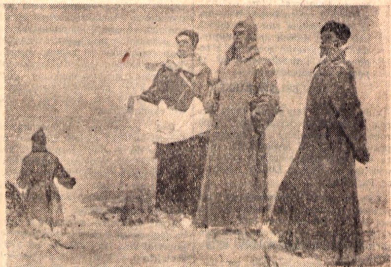
Józef Stalin i Feliks Dzierżyński na froncie wschodnim.

Stalin jest nam szczególnie drogi i bliski: jako wódz narodu bu-