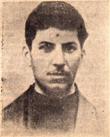
Józef Stalin w wieku lat 17 jako uczeń seminarium duchownego w Tyflisie

W roku 1879 w gruzińskim mieście Gori, w rodzinie robotnika i córki pańszczyźnianego chłopca urodził się Józef Wissarionowicz Dżugaszwili (Stalin). W wieku lat 15-tu jest już rewolucjonistą. W r. 1898 wstępuje do pierwszej gruzińskiej organizacji socjaldemokratycznej i wkrótce staje na jej czele. „Nie każdemu — mówił w 1924 roku — jest dane znieść trudy i burze, związane z przynależnością do takiej partii. Synowie klasy robotniczej, synowie niedoli i walki, synowie niestychanych cierpień i bohaterskich wysiłków — oto kto, przede wszystkim powinien być członkiem takiej partii”.