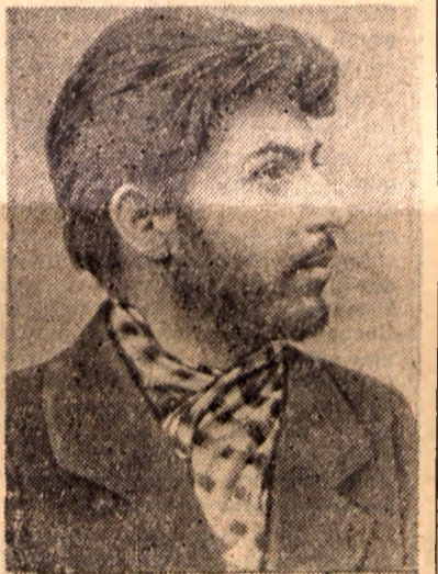
Józef Stalin (fotografia z roku 1900)

Nad mogiłą Lenina złożył w imieniu tej partii uroczystą przysięgę: strzec jak oka w głowie jedności partii i zwartości jej szeregów, rękami zwycięstw klasy robotniczej. W zaciętej walce z oportunistami wszelkiej maści, z trockistami, bucharinowcami i innymi zdrajcami klasy robotniczej Stalin zespolił partię pod zwycięskim sztandarem leninizmu. Jako wódz partii i narodu Stalin wyostrzał oręż świadomości członków partii, uczył czujności wobec wroga kla-