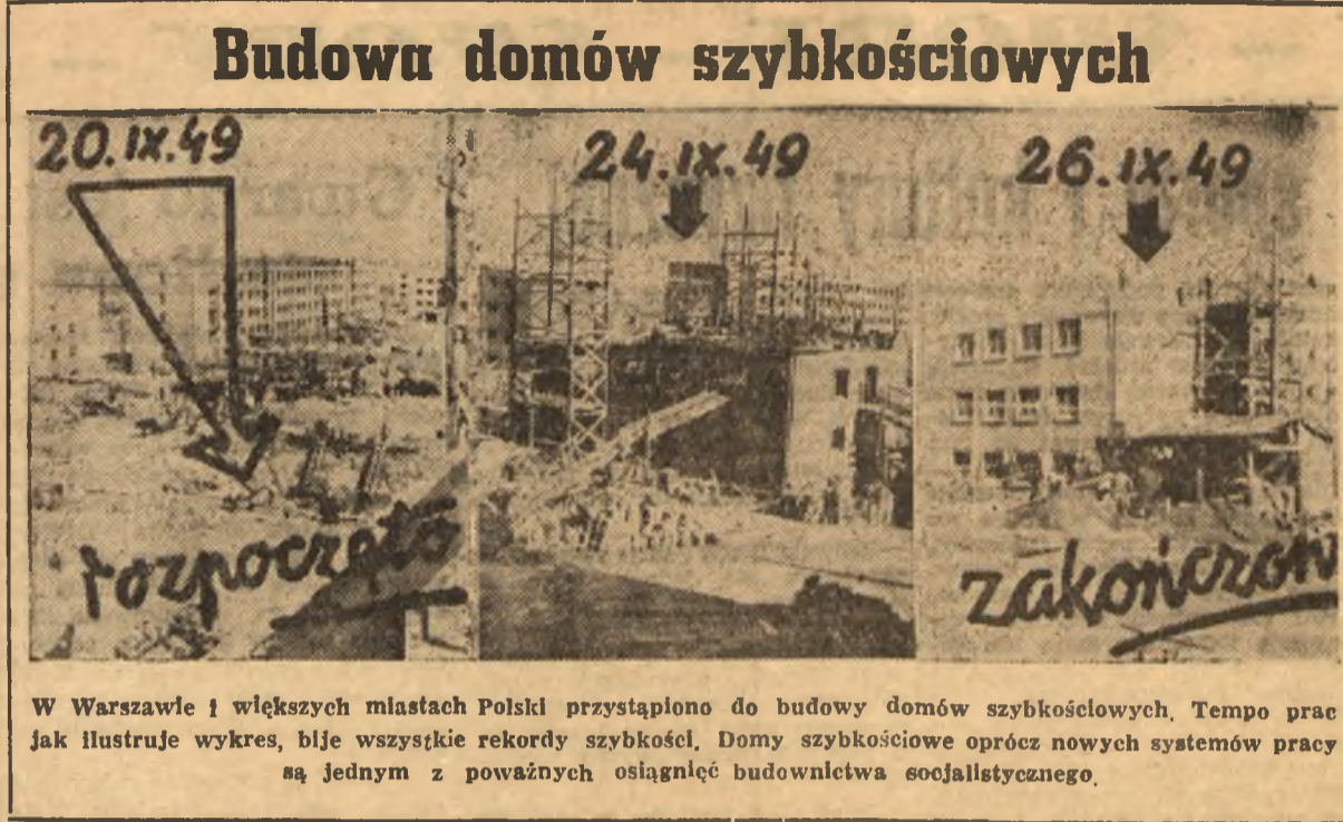
W Warszawie i większych miastach Polski przystąpiono do budowy domów szybkościowych. Tempo prac jak ilustruje wykres, bije wszystkie rekordy szybkości. Domy szybkościowe oprócz nowych systemów pracy są jednym z poważnych osiągnięć budownictwa socjalistycznego.

W liście opisano zniszczenia w Polsce z ostatniej wojny i osiągnięcia robotników przemysłu cukrowniczego w odbudowie zdewastowanych zakładów pracy. Pod-